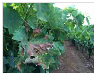
Cambia il clima, non la peronospora