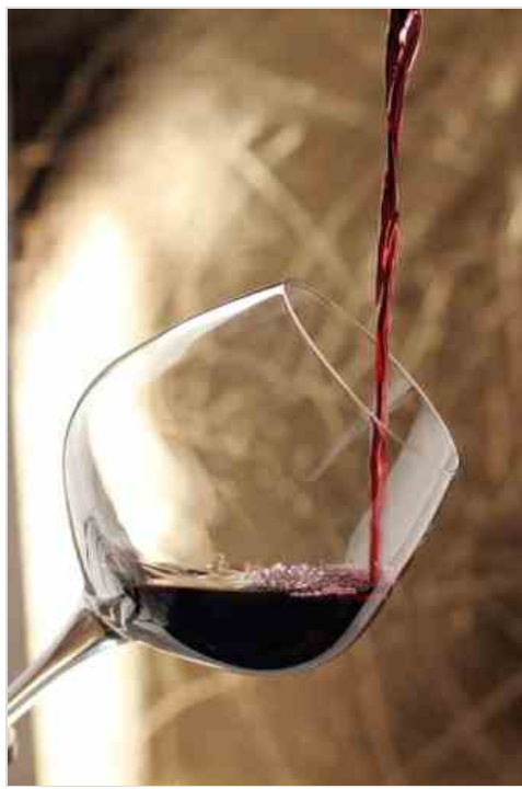
La Calabria esporta il 15% delle bottiglie prodotte e registra una crescita del 2,5% nella produzione bio

La Regione Calabria parteciperà alla 51° edizione di Vinitaly , il Salone internazionale dei vini e distillati di Verona che si terrà dal 9 al 12 aprile 2017 , con un proprio stand curato dal dipartimento Agricoltura. Saranno 58 le aziende produttrici di vino , due in più rispetto al 2016, e due di liquori che insieme ai Consorzi di tutela "Vini Doc Cirò e Melissa" e "Vini Dop Terre di Cosenza" , offriranno la possibilità di degustare le nuove annate di circa 500 etichette calabresi.