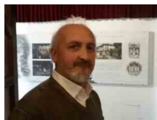
Fitoiatria, nobile arte