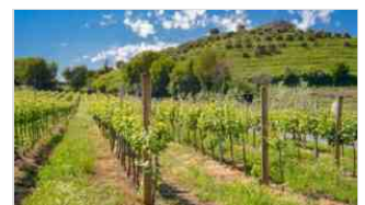
Vino e vigne biologiche